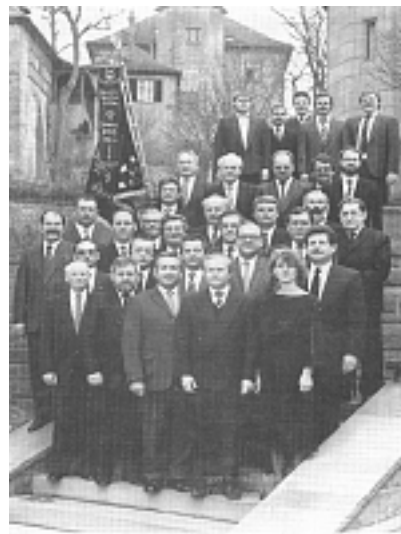
Die ersten Sänger im Juli 1864

Der Gemischte Chor „Sängerbund“ Mahlberg e.V. feiert sein 150 jähriges Bestehen.