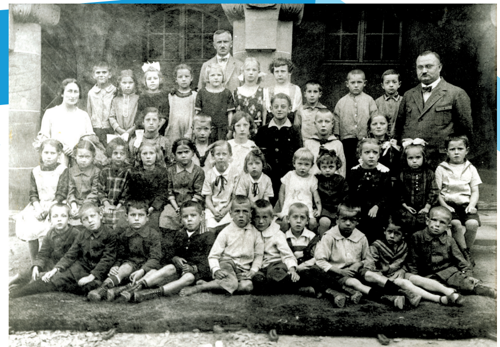
Klassenfoto 1927 | Mohlbürger Schüler/innen der Jahrgänge 1918-1921

„ES RIESELTE UNABLÄSSIG DURCH UNDICHTER STELLEN.“