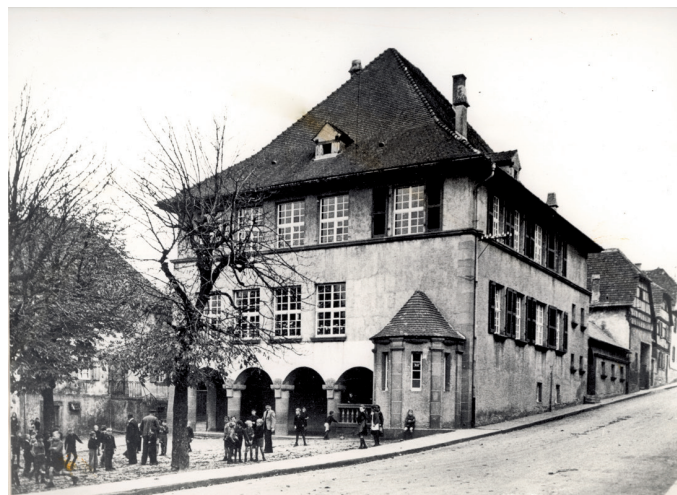
Unsere alte Schule um 1950 | Heute Karlsapotheke

„DAS MINIKOLLEGIUM HATTE EINEN FAMILIÄREN CHARAKTER.“