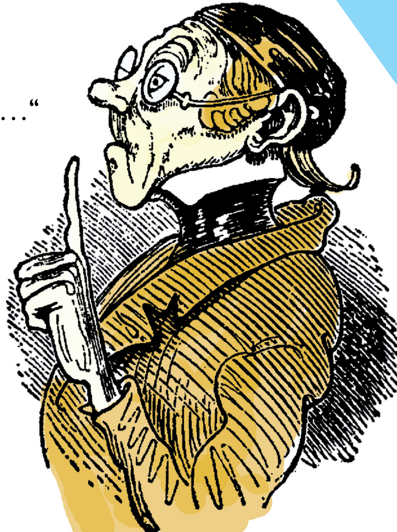
Wilhelm Buschs Lehrer Lämpel

Als durch schulpolitische Verordnung Orschweierer Schüler nach Mohlbürg mussten, gab es Unmut in der dortigen Bevölkerung. Man fragte sich, ob im Ort ein „Bildungsnotstand“ herrsche und zudem sei der Anstieg zu der Schule auf dem Buckel beschwerlich. Diese Aussage reizte mich, an Fasnacht einen karikierenden Umzugswagen mit nach vorne gebeugten Schülern Richtung Mohlbürg pilgernd mit Blick auf das Schloss zu fertigen.