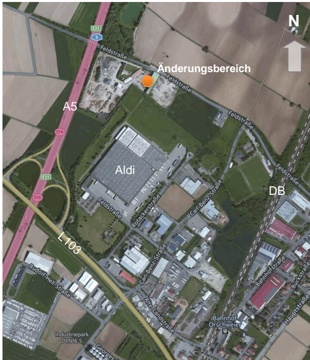
Abbildung 1 – Luftbild der Umgebung

Der Änderungsbereich befindet sich in der Stadt Mahlberg etwa 1.500 m Luftlinie vom Stadtkern in südwestlicher Richtung an der ‚Feldstraße‘ im OT Orschweiler und ist gekennzeichnet durch die bereits angesiedelte Firma „Singer GmbH Entsorgungcenter Orschweiler“.