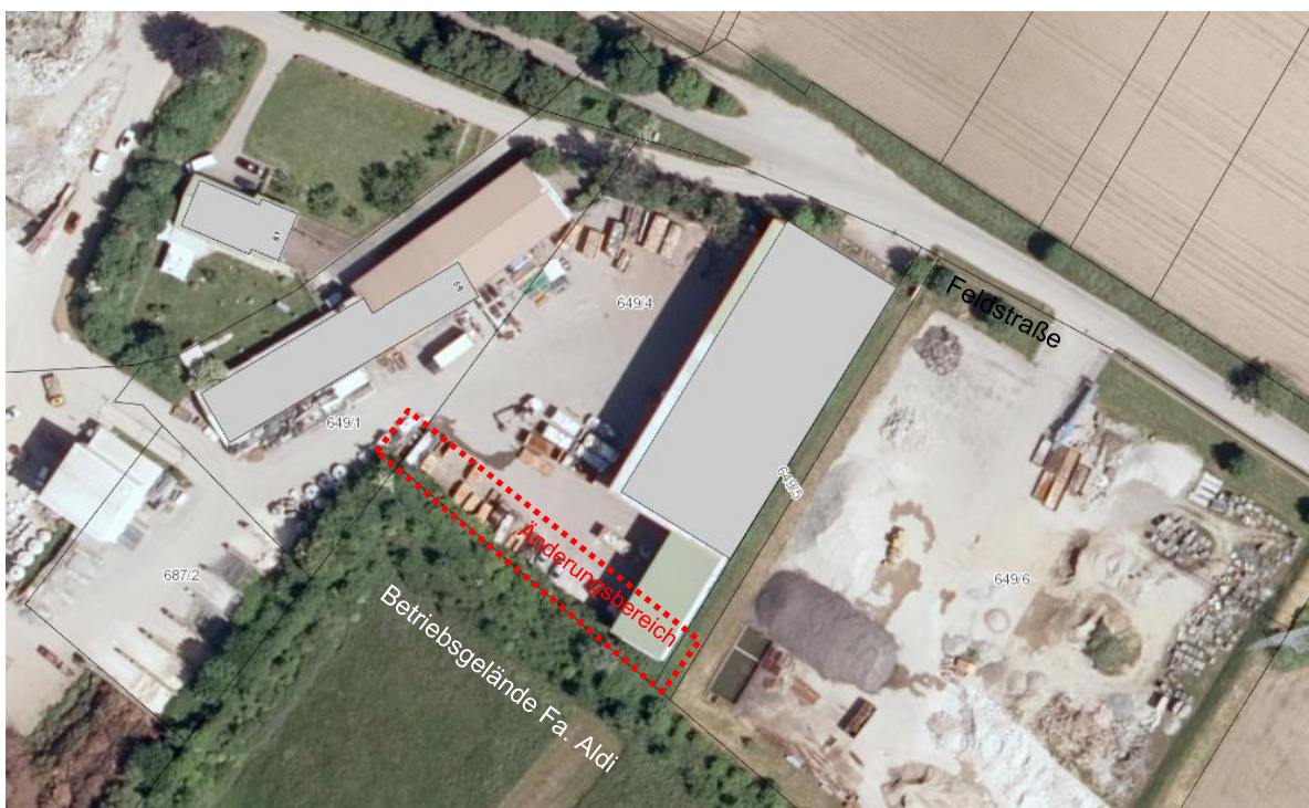
Abbildung 2 – Luftbild des Betriebsgeländes (Änderungsbereich schematische Darstellung)

Die Ver- und Entsorgung des Areals ist bereits sichergestellt. Der Änderungsbereich befindet sich außerhalb des Einwirkungsbereichs von Störfallbetrieben.